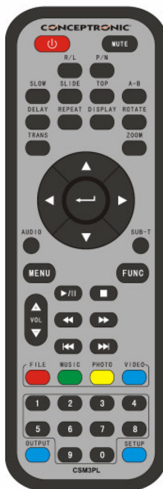
CSM3PL Rev. 2